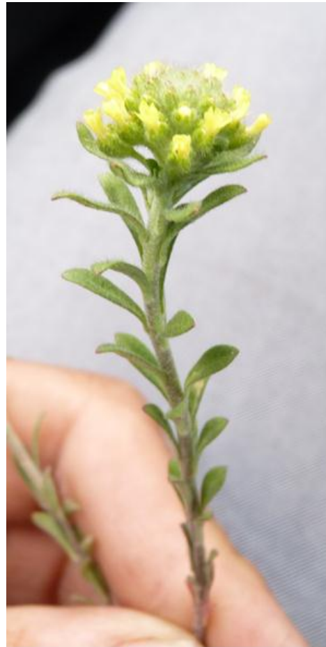
Foto över växtplats och närbild på grådådra i Jönköping.