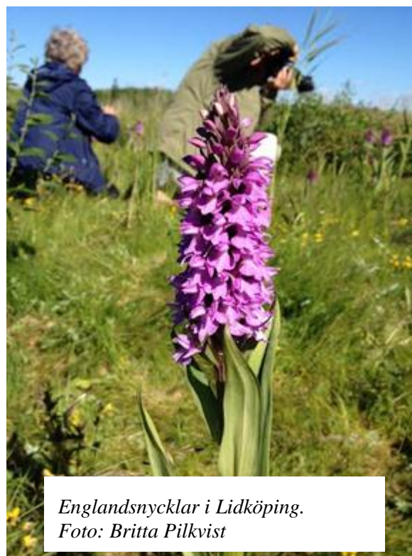
Englandsnycklar i Lidköping.