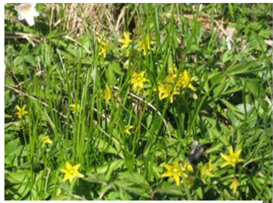
Lundvårlök finns rikligt vid Bondberget, Foto: Martin Sjödahl

Den tydliggör de höga naturvärden som finns på Bondberget.