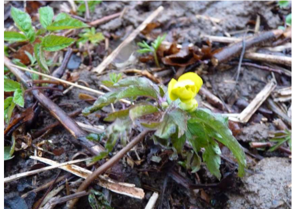
Vårens första gulsippa?