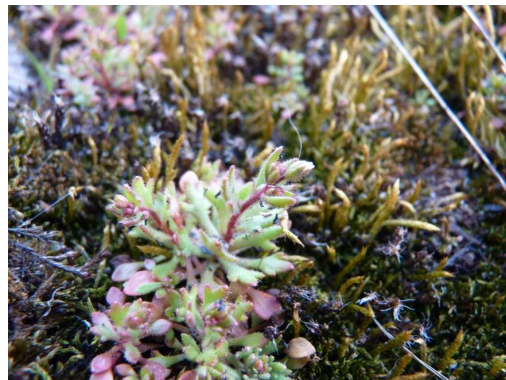
Grusbräcka i knopp, 2013-04-28